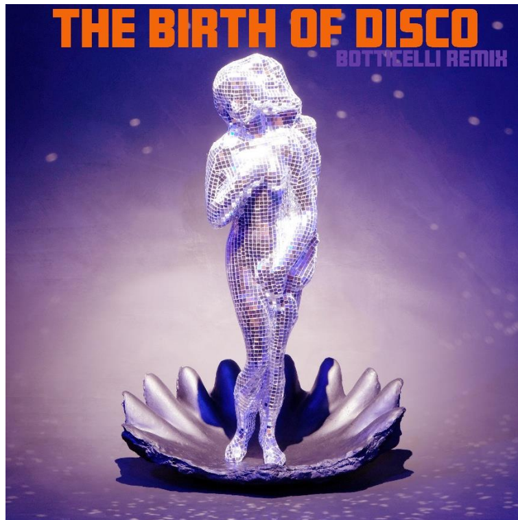
©Paul March, The Birth of Disco , 2025, Pochette de disque, 31.5 x 31.5cm