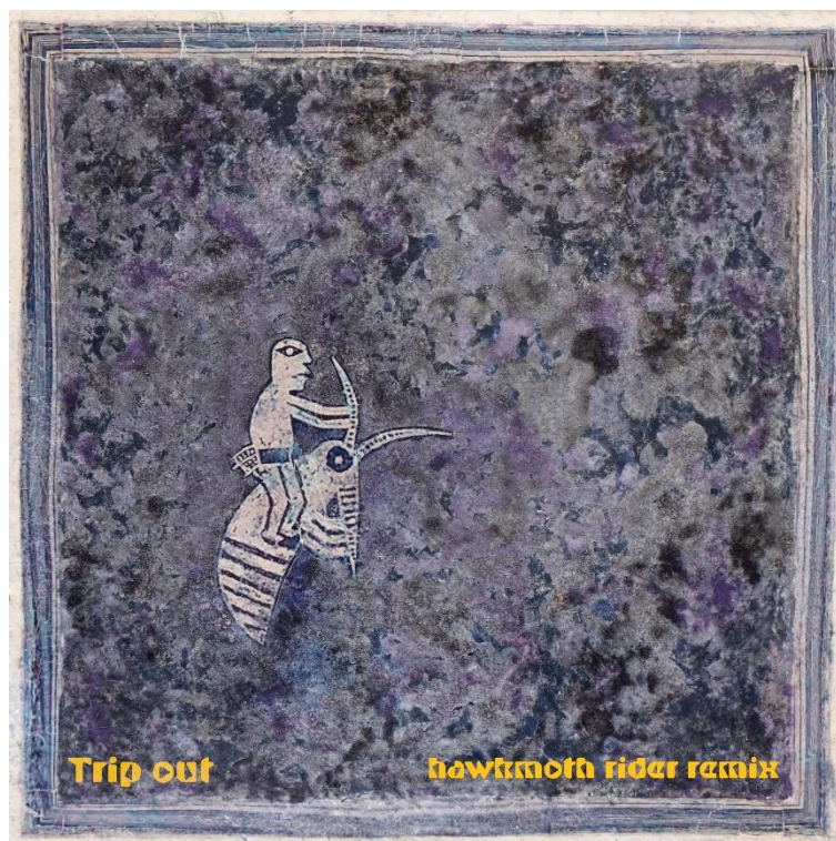
©Paul March, Trip Out, 2025, Pochette de disque ,31.5 x 31.5cm

Mon amour pour la musique ne s'est qu'intensifié au fil des années. Plus tard dans ma vie, bien que je sois devenu artiste, créant des sculptures et des installations, mon incapacité à faire de la musique est restée une source implacable de frustration. Il y a quelques années, j'ai trouvé une stratégie. Et si je concevais une pochette de disque pour une musique qui n'existait pas encore, que je lui donnais un titre, et que je demandais à un musicien de composer un morceau uniquement sur la base de l'image et du titre ? Au lieu que la pochette accompagne le disque, l'image donnerait voix au disque. La vision deviendrait son à travers la synesthésie. Felix Appleby, musicien, interprète, compositeur et DJ, a accepté de se charger du son. Quant à la vision, je ne suis pas graphiste. Je travaille en 3D, donc le processus de création des pochettes était avant tout matériel et sculptural plutôt que graphique et numérique. The Hills are Alive est le résultat de cette collaboration – une collaboration non seulement entre deux personnes – deux artistes, mais aussi entre les matériaux non humains et les objets qui se sont réunis pour conceptualiser chaque pochette – de véritables choses avec leurs propres intentions et leurs propres vies. Chaque pochette a développé son propre esprit et son propre son, et l'exposition présente non seulement les six pochettes et leurs mises en musiques, mais aussi le processus par lequel chacune a pris vie.