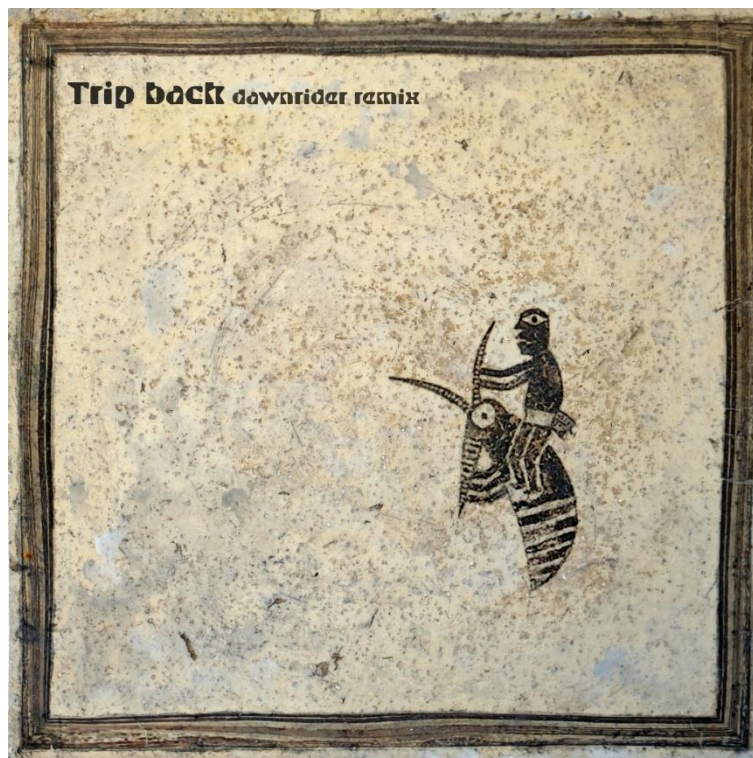
©Paul March, Trip Back 2025, Pochette de disque ,31.5 x 31.5cm

Quand j'avais cinq ans, j'ai demandé à mes parents si je pouvais apprendre à jouer du piano. Ils ont accepté à condition que je m'exerce tous les jours et que je n'abandonne pas. Une semaine plus tard, j'en avais déjà assez et je voulais arrêter, mais pendant les dix années suivantes, ils m'ont forcé à continuer – parfois violemment. Dans ces conditions, j'ai fait peu de progrès. Cette souffrance a détruit tout intérêt et tout talent que j'aurais pu avoir pour la création musicale et a créé un contraste douloureux avec la joie que je ressentais en écoutant d'autres personnes faire de la musique.