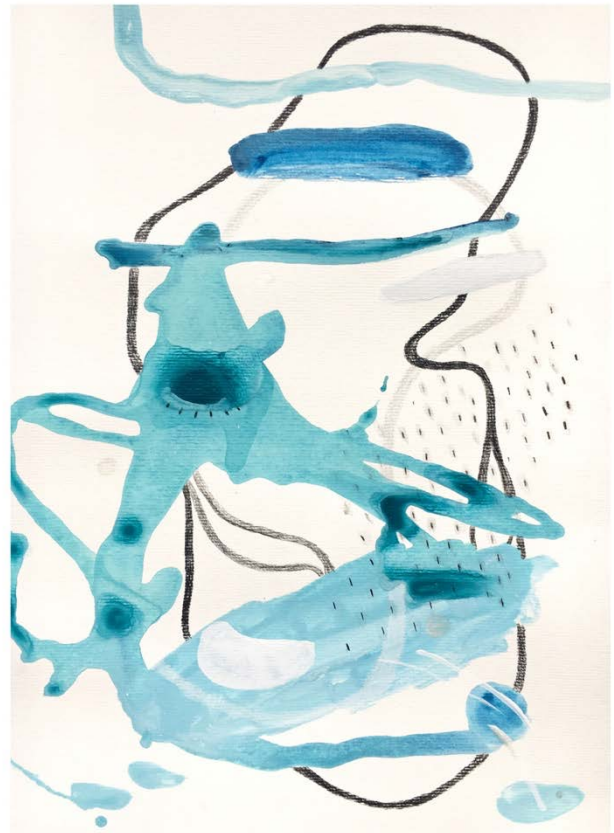
© Sophie Bosselut, Douce Rage, sinuosités, intraveineuse de rêves peu sages... , Graphite et acrylique sur papier 270gr, 30X40cm, 2020