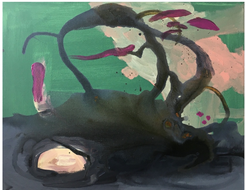
© Sophie Bosselut, Les Racines du Ciel , Acrylique sur toile, 40x50cm, 2019

« C'est tellement mystérieux, le Pays des Larmes » (Phrase extraite du Petit Prince de Saint Exupéry)