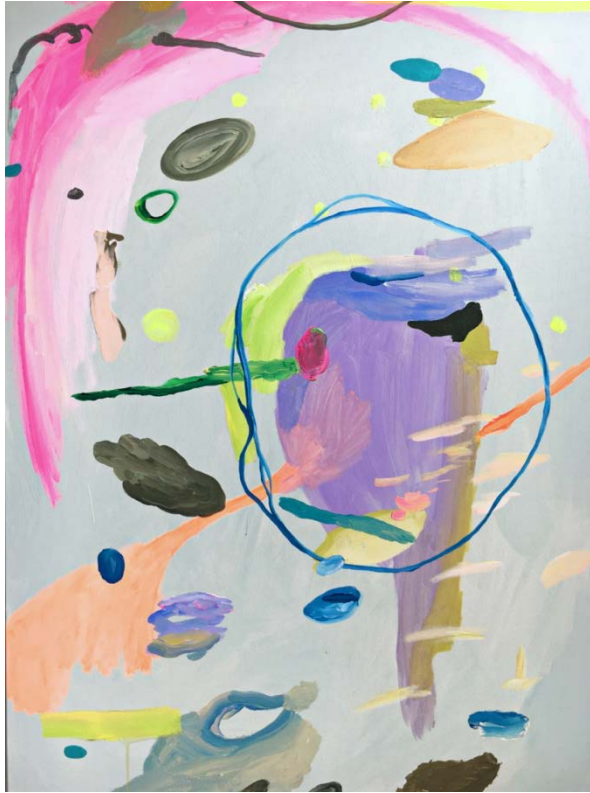
© Sophie Bosselut, Je suis la Fleur dans leurs Cerveaux , Pigments, acrylique sur toile, 100x140cm, 2020