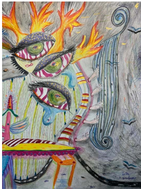
© Sophie Bosselut, One million lashes extension - Intervention Divine (Détails) , Aquarelle, crayons de couleurs et graphite sur papier 270 gr, 29,7x42cm, 2024

Finissage de l'exposition en présence de l'artiste