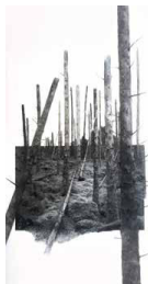
Yggdrasil #11, 2023

Tirage pigmentaire sur papier Kozo 110 g et dessin au fusain, pastel sec 30 x 60 cm / 40 x 70 cm encadré