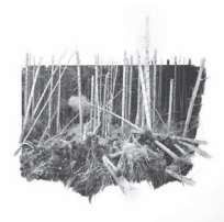
Yggdrasil #02, 2024 Tirage pigmentaire sur sur papier Bamboo Hahnemuhle 290 g et dessin au fusain, pastel sec 52 x 52 cm / 57 x 57 cm encadré