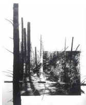
Yggdrasil #23, 2023 Piezographie sur papier Bamboo Hahnemühle 290 g et dessin au fusain, pastel sec 30 x 35 / 40 x 45 cm encadré