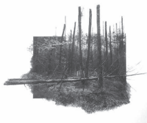
Yggdrasil #10, 2023 Tirage pigmentaire sur papier Kozo 110 g et dessin au fusain, pastel sec 45 x 40 cm / 55 x 50 cm encadré