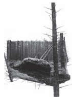
Yggdrasil #06, 2023 Tirage pigmentaire sur papier Bamboo Hahnemuhle 290 g et dessin au fusain, pastel sec 50 x 80 cm / 60 x 90 cm encadré