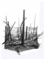
Yggdrasil #24, 2024 Piezographie sur papier Bamboo Hahnemuhle 290 g et dessin au fusain, pastel sec 50 x 60 cm / 55 x 65 cm encadré