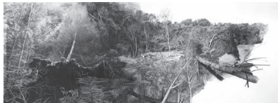
Yggdrasil #01, 2023

Tirage pigmentaire sur papier Kozo 110 g et dessin au fusain, pastel sec 25 x 70 cm / 30 x 75 cm encadré