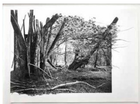
Yggdrasil #20, 2022 Piezographie sur papier Bamboo Hahnemühle 290 g et dessin au fusain, pastel sec et pierre noire 50 x 70 cm / 60 x 80 cm encadré