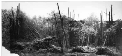
Yggdrasil #08, 2023 Tirage pigmentaire sur papier Bamboo Hahnemühle 290 g et dessin au fusain, pastel sec 45 x 90 cm / 50 x 100 encadré