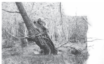
Yggdrasil #09, 2023 Tirage pigmentaire sur papier Kozo 110 g et dessin au fusain, pastel sec 30 x 55 / 40 x 60 cm encadré