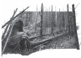
Yggdrasil #05, 2023

Tirage pigmentaire sur papier Kozo 110 g et dessin au fusain, pastel sec 60 x 70 cm / 70 x 80 cm encadré