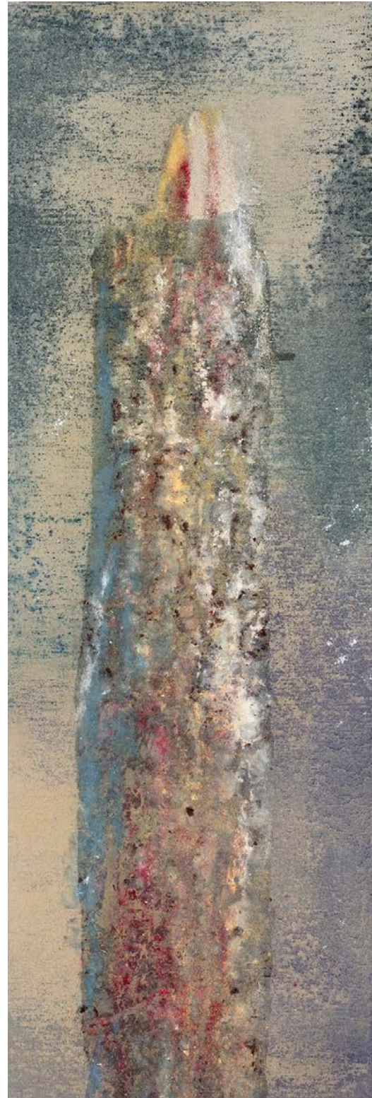
Petit frottage 3, technique mixte sur toile, 100 x 30 cm, 2009