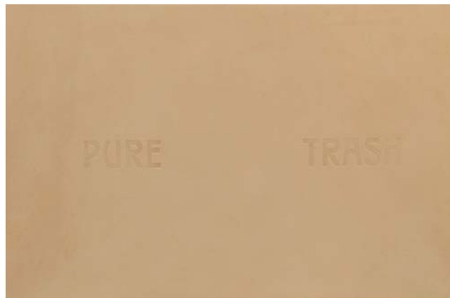
Trash peau, cuir sur châssis, 40 x 60 cm, 2013