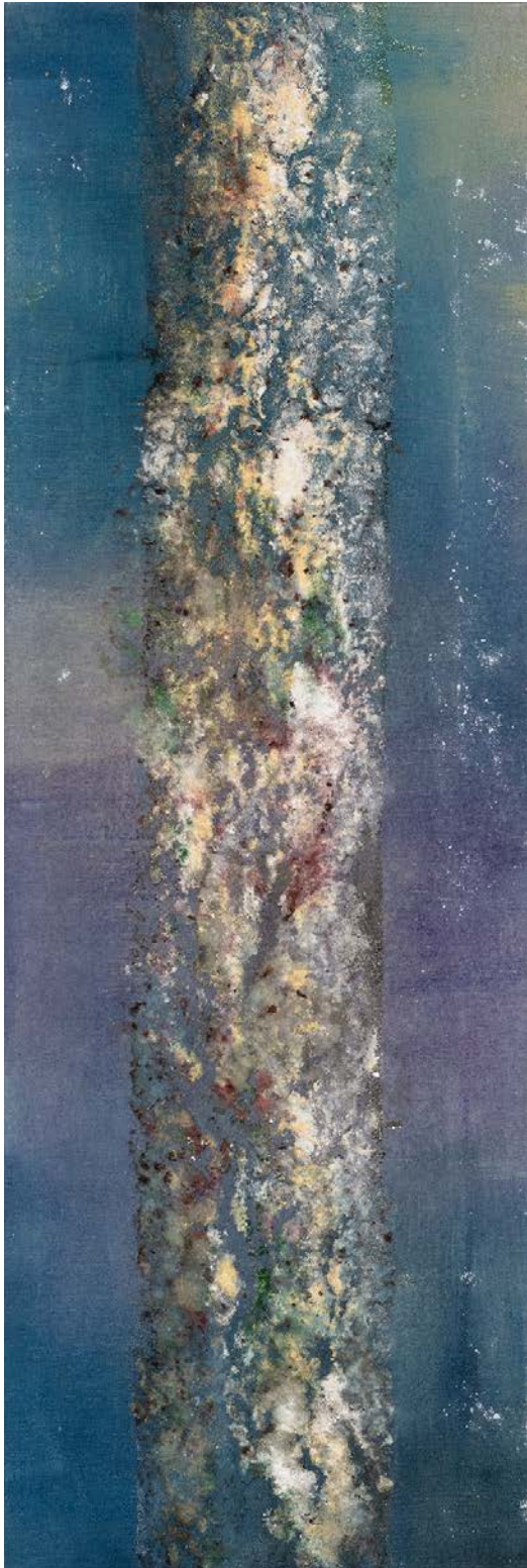
Petit frottage 1, technique mixte sur toile. 100 x 30 cm, 2009