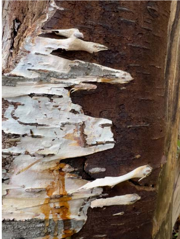
Ecorces vives, photographie sur papier FineArt Hahnemühle baryte, 30 x 40 cm, 2023