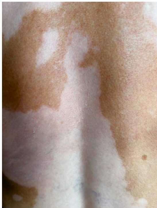
Ecorces vives, photographie sur papier FineArt Hahnemühle baryte, 30 x 40 cm, 2023