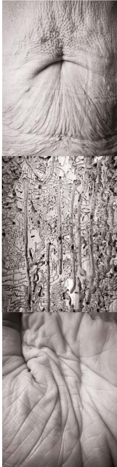
Ecorces vives, photographie sur papier FineArt Hahnemühle baryte, 30 x 40 cm, 2023