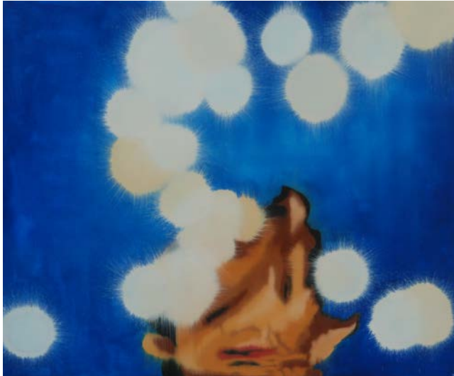
Pure Trash, huile sur toile, 50 x 60 cm, 2013