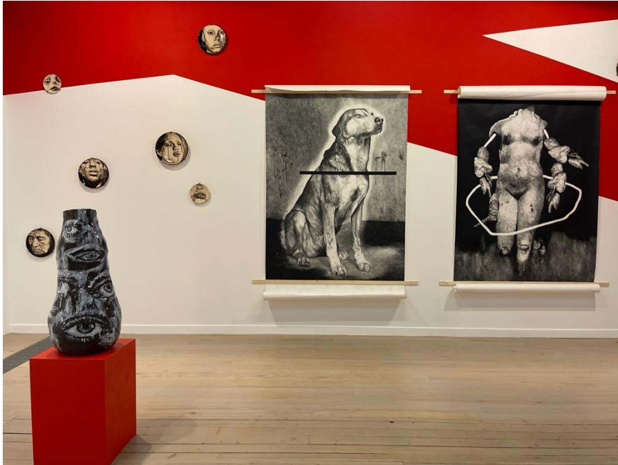
Vue de l'exposition « L'or de tes doigts m'a fait creuser jusqu'au bleu », Artothèque de Caen 2021

Cette proposition conçue par Myriam Mechita pour Art Now Projects fait suite aux deux installations récemment présentées à l'artothèque de Caen et à la Fondation Salomon. Elle en constitue à la fois un écho et un prolongement, alors même que la géographie mentale, sentimentale et expérimentale de l'artiste se déplace de ville en ville. Sorte d'antichambre sourde et silencieuse, les murs sont peints avec des éléments géométriques très graphiques.