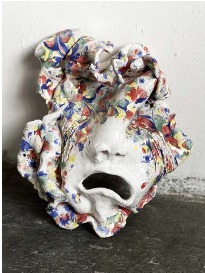
Les soupirs bleus, 31 x 24 x 10 cm, céramique émaillée, 2022 © Myriam Mechita

Vernissage le samedi 27 août de 14h à 19h Exposition du 27 août au 10 septembre 2022